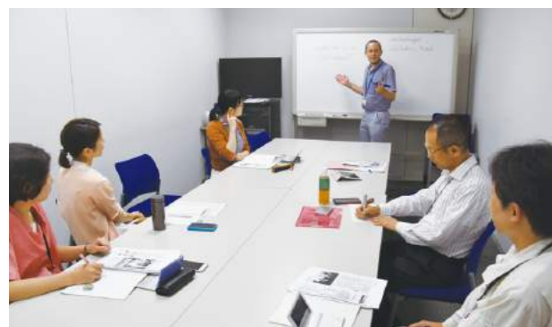
週1回行う社内英会話教室(ADEKA)

ADEKAグループは、2025年にありたい姿として掲げる「先端技術で明日の価値を創造し豊かなくらしに貢献するグローバル企業」を実現するため、国や地域を越えて活躍できる人財の育成に注力しています。