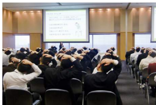
メンタルヘルセルフケア研修

メンタルヘルス疾患患者へは、スムーズに職場復帰できるように短時間勤務制度を適用したADEKA職場復帰支援プログラムを導入しており、セカンドオピニオンの活用や職場復帰後の定期的な産業医面談の内容から、適切な復帰プログラムを講じています。