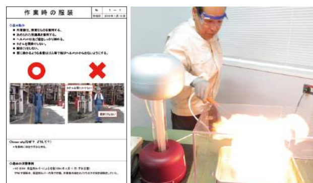
安全基本行動集 (ADEKAグループ) 安全体感研修

さらに、当社新入社員(研究、技術、生産職)全員に、浦和開発研究所に設置する安全体感研修施設にて有機溶媒の発火やローラー巻き込みなどを実際に体感する研修を義務付けており、延べ60名が受講しました。