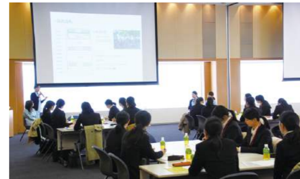
理系女子学生を対象とした活躍推進セミナー開催

採用活動においては、理系女子学生を対象に様々な世代の女性社員と交流をする「女性活躍推進セミナー」の実施など、女性の採用を積極的に進めています。2018年4月に入社した新卒従業員91名のうち、18名が女性でした。